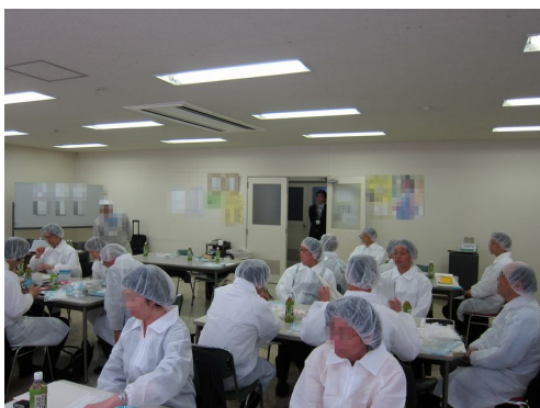
外部研修(工場見学)